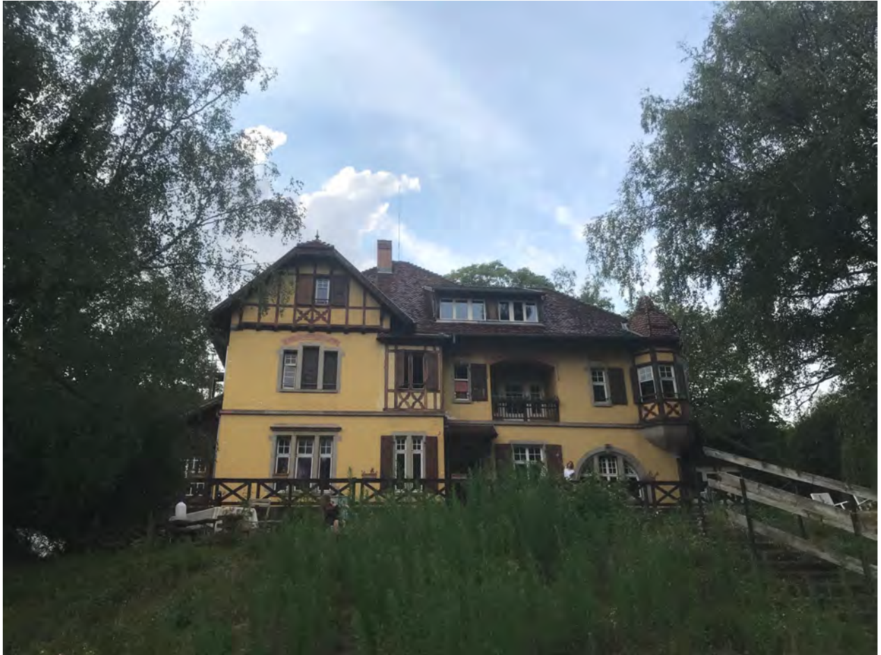
Die alte Villa aus dem späten 19. Jh gibt uns eine zwar spartanische, aber doch gute Unterkunft.

Nachmittag haben wir den Altar sehr schön errichtet und vor ihm findet nun der erste Abendabschluss statt. Die beiden Jungs, die Ministranten heute Abend sind, verwechseln so ziemlich alles, aber stimmungsmäßig ist es sehr schön. Ich spüre, wie der „Pokutje-Geist“ schon ganz nahe ist.