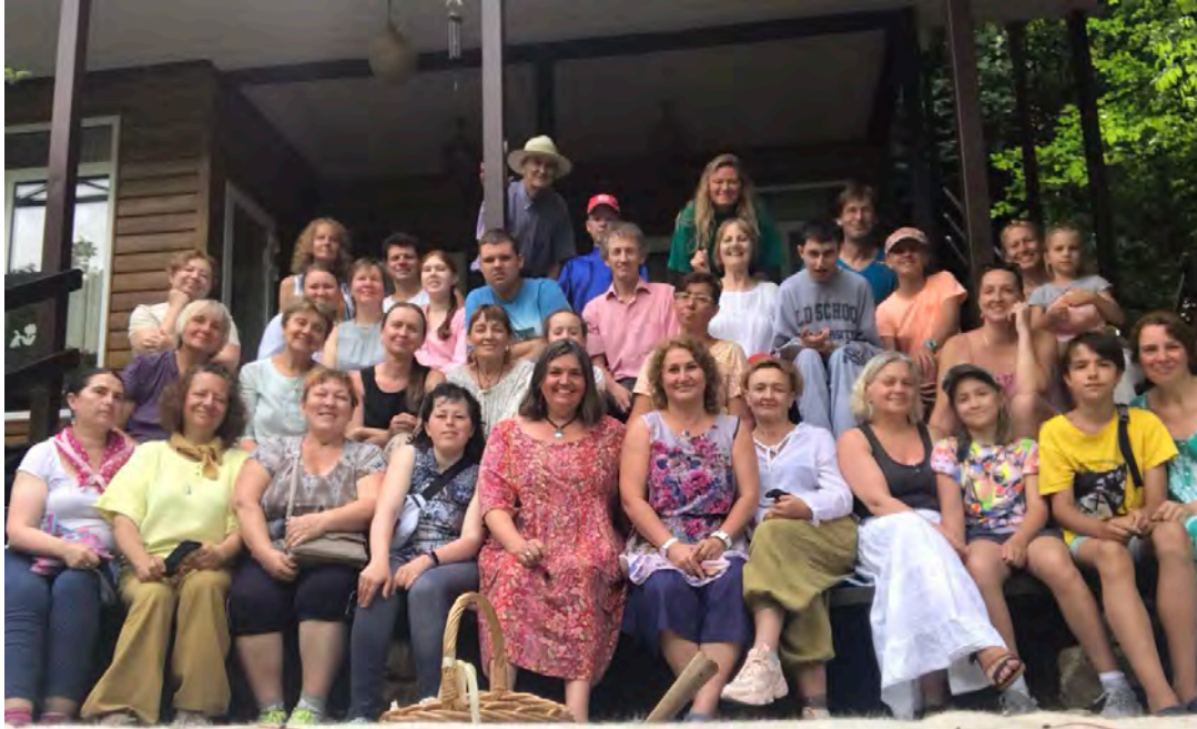
Einige sind bereits abgereist, einige waren nur kurz da, ein paar sind noch krank. Insgesamt waren es 68 Teilnehmer.